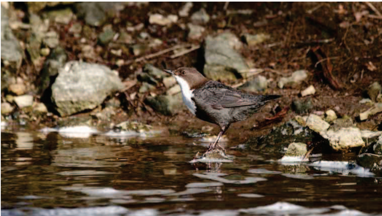
Ūdensstrazds Cinclus cinclus .

Autoru adreses: info@ledins.lv, aigars.kalvans@vmd.gov.lv