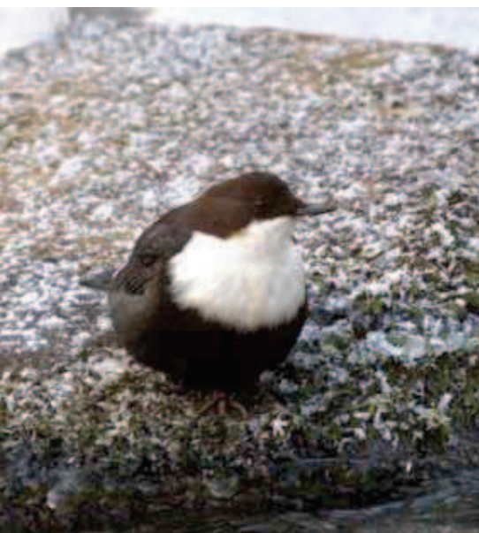
Ūdensstrazds. Annenieki, 12.01.2013.

Runājot par sekmēm ūdensstrazdu jomā – būriši sevi attaisnoja kā ziemojošo putnu iecienīta naktsmītne, kas dod gulēšanai nepieciešamo pamatni,