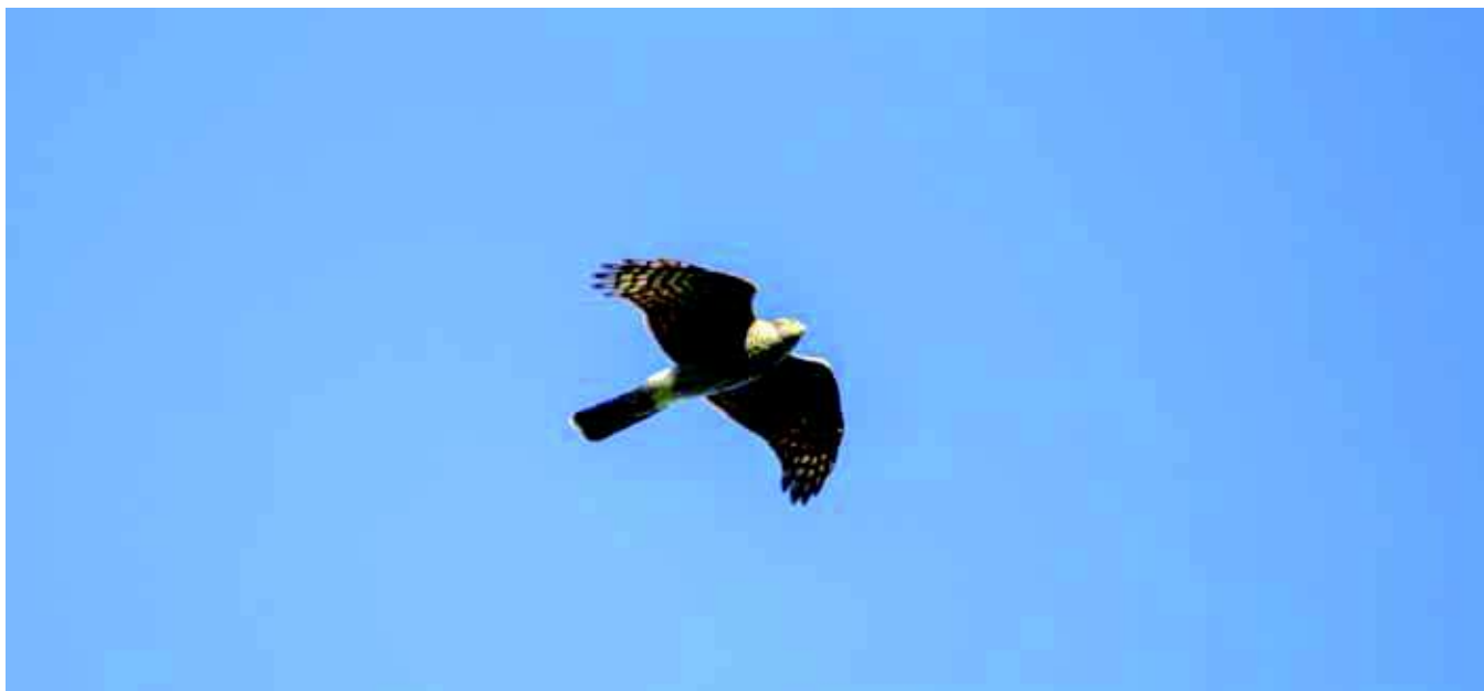
Zvirbuļvanags Accipiter nisus .