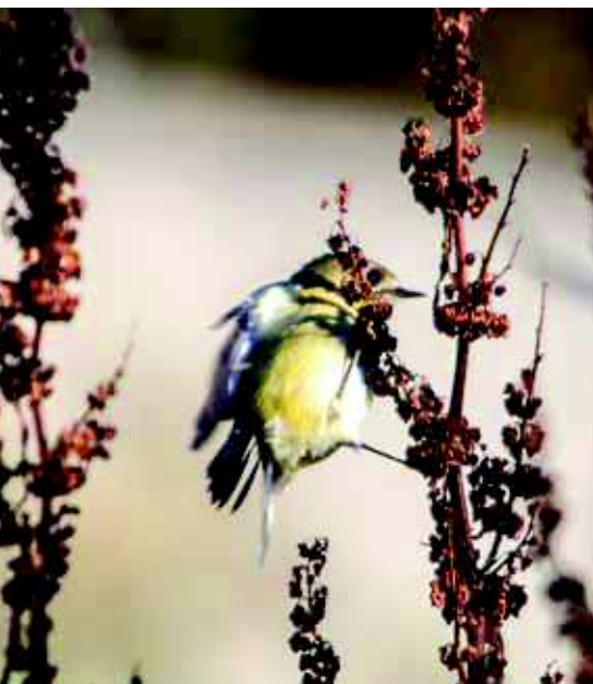
Zeltgalvītis Regulus regulus .

migrācija, un, kā tas jau bija paredzams, jaunas sugas sarakstam nāca ļoti strauji. Apkārt mums stāvēja daudzas citas komandas, kas gan centās īpaši nepievērst konkurentu uzmanību saviem novērojumiem – klusinātas balsis, čuksti un vispārēja nosvērtība. Nezinātājs varbūt nemaz ī nepateiktu, ka šajā mierīgajā saullēkta brīdī komandas patiesībā drudzaini vēro, klausās un atzīmē sarakstos citu jaunu sugu pēc citas! Pēc kādas pusotras stundas satikāmies ar otru komandas pāri un noskaidrojām, ka viņi bija redzējuši daudz ko tādu, ko nebijām redzējuši mēs, un otrādi. Ventes raga potenciāls šķita jau gandrīz izsmelts – protams, varētu stāvēt un gaidīt, kad vēl kas jauns pārlidos mums pāri (un noteikti kaut ko jau arī sagaidītu), bet laiks mums bija atvēlēts tikai 12 stundu un, izvērtējot situāciju, nolēmām ap plkst. 9.45 atkāpties. Ātrs provizorisko rezultātu apkopojums atklāja, ka pa visiem jau bijām saskaitījuši 70 sugu! Sākums ļoti veiksmīgs!