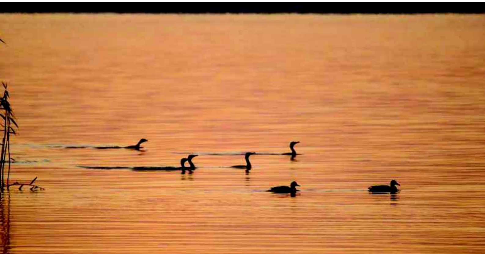
Jūraskraukļi un meža pīles sacensību rītā pie Ventes raga Kuršu jomā.